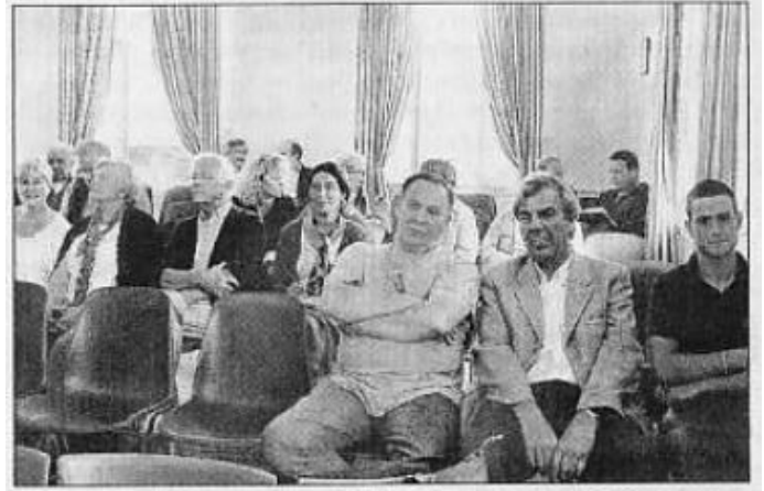
Les membres de l'association ont fait savoir leur volonté de développer davantage de concertation avec la municipalité.

Douze ans après, l'association Blangy-Environnement est toujours active et fidèle à son objectif de veiller au développement harmonieux de la commune de Blangy-le-Château dans le respect de l'environnement et de l'intérêt général de ses habitants. À titre d'exemple, notre volonté de mettre en valeur notre village, nous a conduit à initier un numéro spécial de la revue de l'Association « Le Pays d'Auge » consacré à Blangy-le-Château en 2012, auquel notre forte contribution montre bien notre activité et l'intérêt que nous portons à notre village.