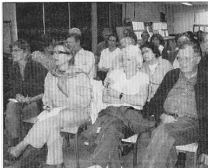
Une quarantaine de personnes a assisté à cette première assemblée