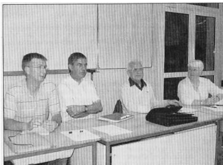
Le Président Bouvier a précisé l'importance du dialogue avec les élus